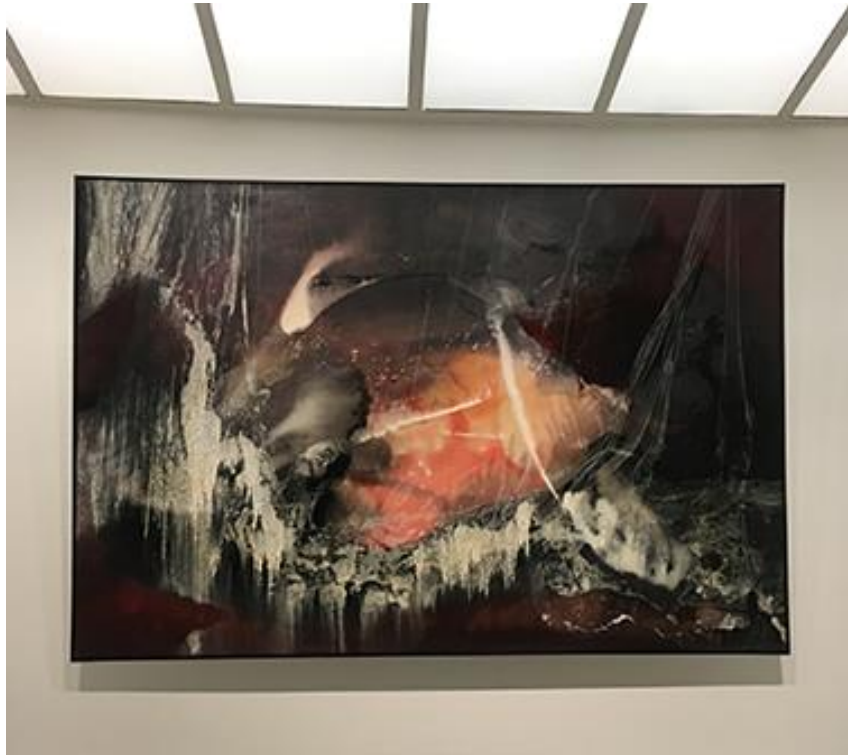
Installation view: Prophecy 1956 by Paul Jenkins oil on canvas 51 x 77 inches 129.5 x 195.6 cm.