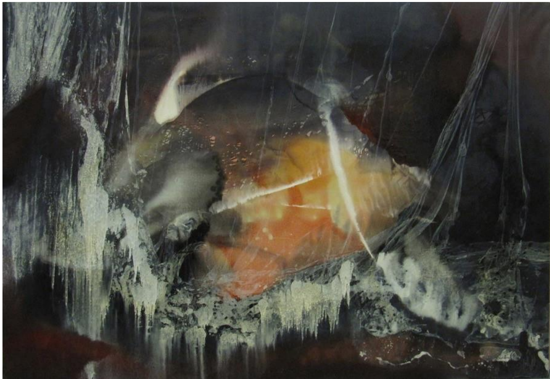
Paul Jenkins Prophecy 1956, oil on canvas, 51 x 77 inches 129.5 x 195.6 cm.